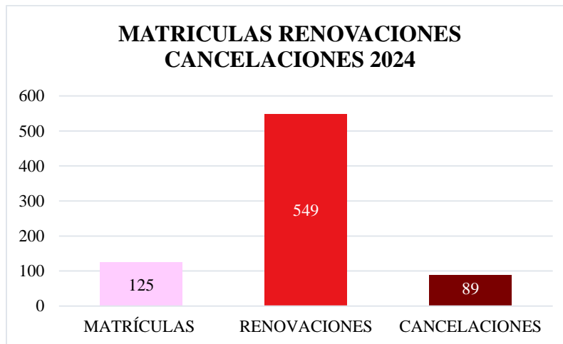
Gráfico 4. Matrículas, renovaciones y cancelaciones 2024