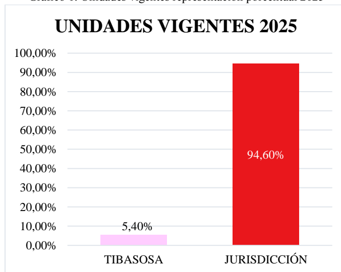
Gráfico 1. Unidades vigentes representación porcentual 2025