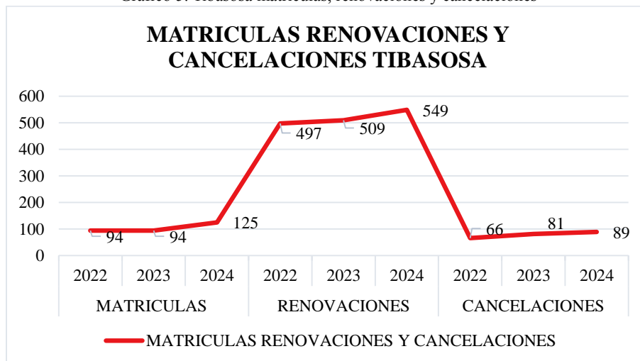
Gráfico 5. Tibasosa matrículas, renovaciones y cancelaciones