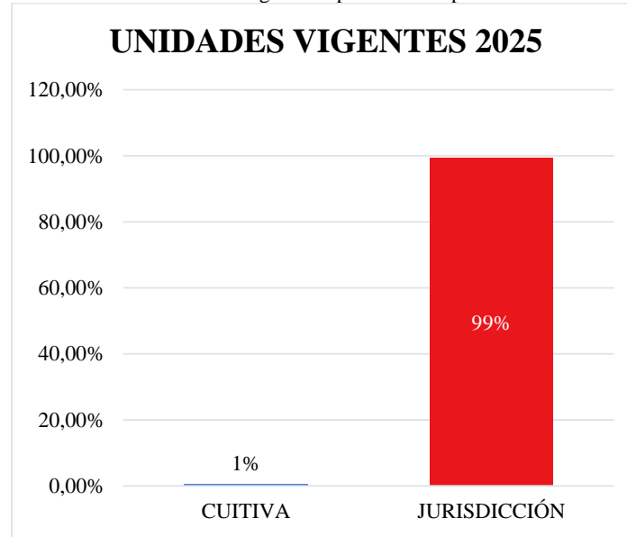
Gráfico 1. Unidades vigentes representación porcentual 2025