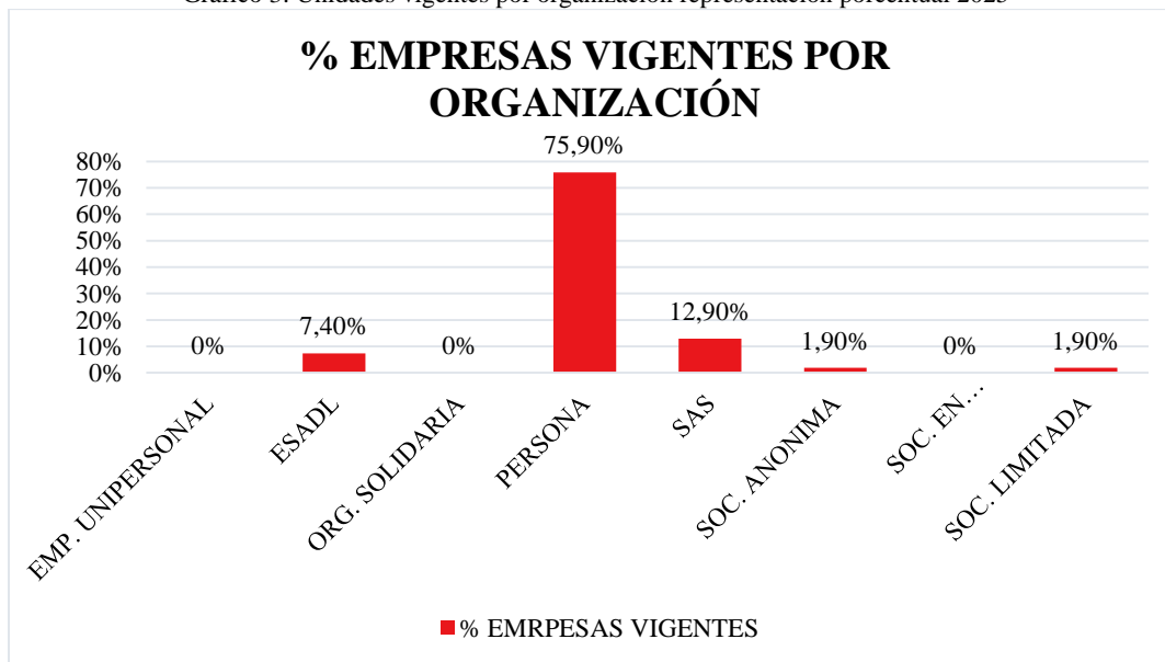
Gráfico 3. Unidades vigentes por organización representación porcentual 2025