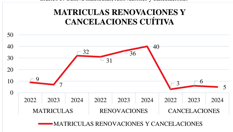
Gráfico 5. Cuítiva matrículas, renovaciones y cancelaciones

Fuente. Cámara de Comercio de Sogamoso – Cálculos (Sistema de registros SII, 31 de diciembre 2024)