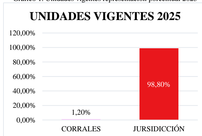
Gráfico 1. Unidades vigentes representación porcentual 2025