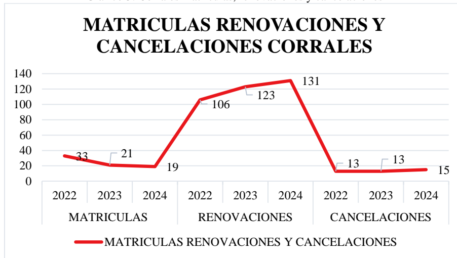
Gráfico 5. Corrales matrículas, renovaciones y cancelaciones