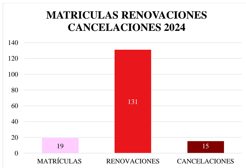
Gráfico 4. Matrículas, renovaciones y cancelaciones 2024