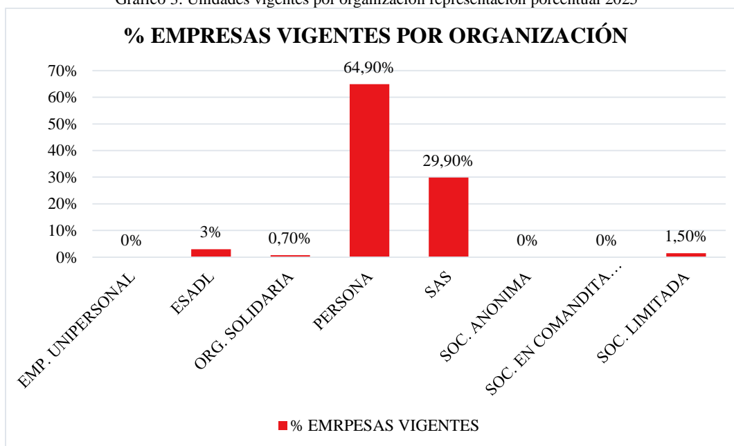
Gráfico 3. Unidades vigentes por organización representación porcentual 2025