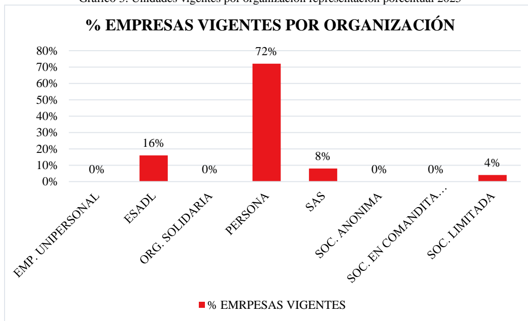
Gráfico 3. Unidades vigentes por organización representación porcentual 2025