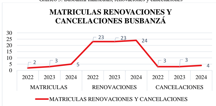
Gráfico 5. Busbanzá matrículas, renovaciones y cancelaciones