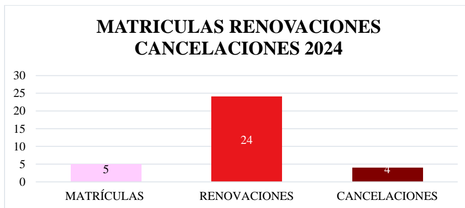
Gráfico 4. Matrículas, renovaciones y cancelaciones 2024