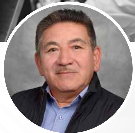
TECHOS ROJOS Asadero -Restaurante

A través del tiempo, se ha consolidado como una empresa pionera en los servicios de catering y eventos en la ciudad con varias distinciones por los servicios prestados a entidades como el Gaula Boyacá, Batallón de Artillería N°1 Tarqui entre otras, fomentando y aportando al desarrollo social y empresarial de la ciudad, dando oportunidades de empleo a estudiantes y practicantes de carreras universitarias afines con esta actividad económica.