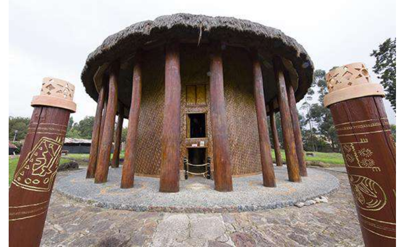
Trabajo Escuela de Ingeniería de Sistemas, Ingeniería Geológica UPTC-Comunidades